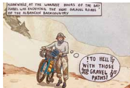
Aquarelle réalisée par Isabel

Aller me baigner avec mon frère ! Inspecter ma chambre et mes affaires haha. Je vais aller me balader dans tous les chemins creux, nettoyer mon vélo, et bien sûr voir tous mes amis... avant de préparer le prochain voyage.