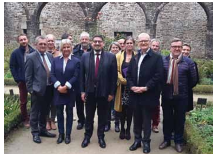
Les membres du bureau du syndicat.

A cheval sur l'Ille-et-Vilaine et les Côtes d'Armor, c'est un territoire comptant désormais 71 communes, et 3 communautés de communes, qui est en train d'émerger, après près de 20 ans de mobilisation et de promotion par l'association Cœur Emeraude. Reste maintenant à concrétiser une dernière étape indispensable à l'avenir de ce projet : celui de la Charte du PNR.